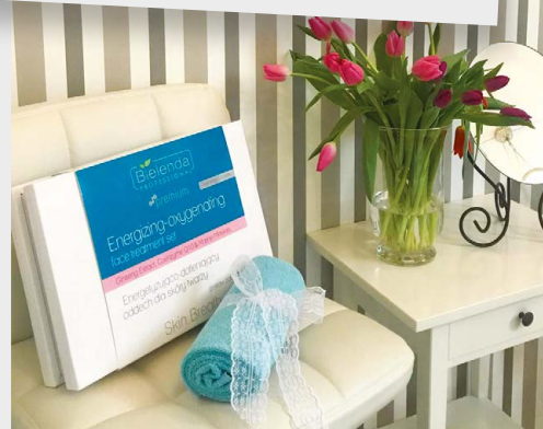
Salon Kosmetyczny Madeline